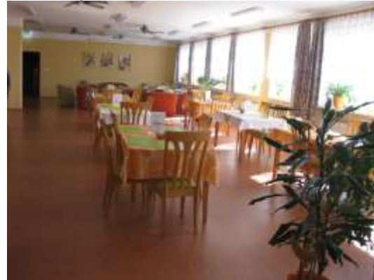
jídelna Javorová 102