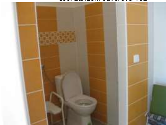
soc. zařízení Javorová 102